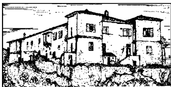
CIRCOLO CULTURALE «IL FITTO DI CECINA» CORSO MATTEOTTI, 101 (ZONA PEDONALE) ivoarzilli@alice.it